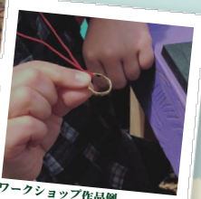
ワークショップ作品例

あらかじめこちらで用意した真鍮のパーツに楕目を入れて表面に模様をつけます。一度に出来る人数は5人~7人まで。小学生以下は保護者同伴です。