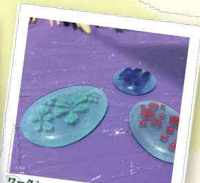
ワークショップ作品例

ガラスに絵付けし、窯で焼成してアクセサリーを制作します(後日発送)。受付は常時、一度に10名が制作可能です。どなたでもご参加可能です。小学生以下は保護者同伴でお願いします。